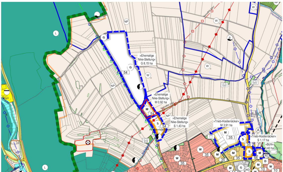
Abb. 3: Auszug aus dem Flächennutzungsplan 2030

Im Flächennutzungsplan des Gemeindeverwaltungsverbands Hardheim-Walldürn ist das Gebiet als gemischte Baufläche dargestellt. Der Bebauungsplan „Hafengrube“ mit der Festsetzung eines Gewerbegebiets, der aktuell von der Gemeinde Hardheim aufgestellt wird, folgt somit nicht dem Entwicklungsgebot nach § 8 Abs. 2 BauGB. Der Flächennutzungsplan wird parallel im Zuge einer Änderung gem. § 8 Abs. 3 BauGB dahingehend geändert.