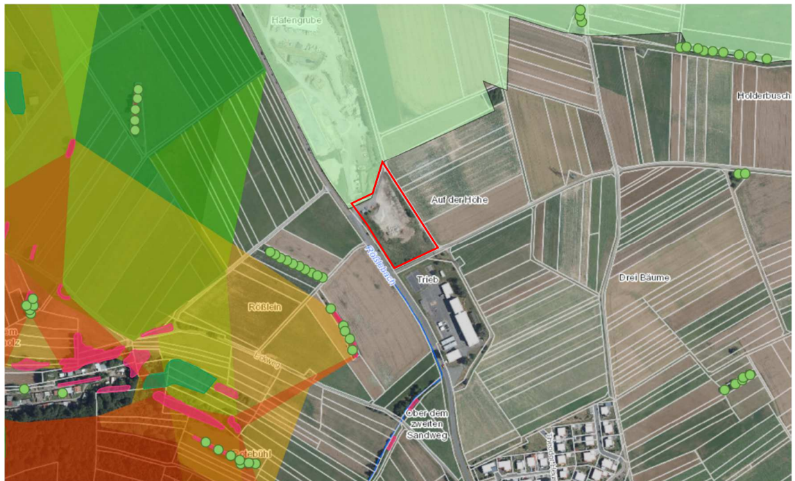
Abb. 4: Schutzgebiete

Im Plangebiet selbst werden keine Schutzgebietsausweisungen nach dem Naturschutz- oder Wasserrecht berührt.