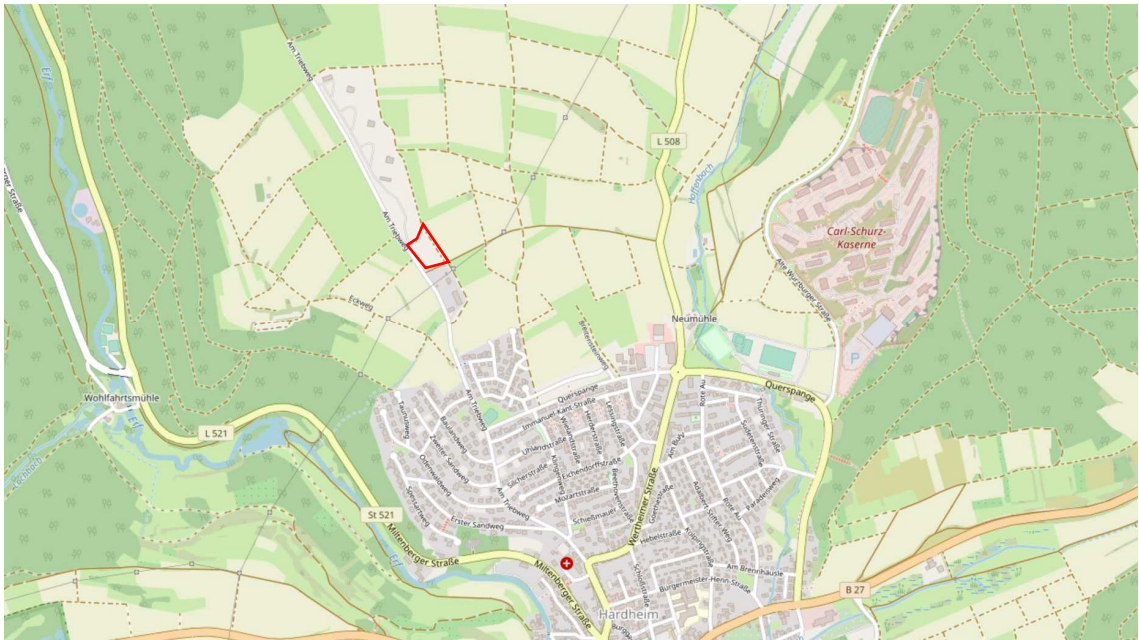
Abb. 1: Auszug aus OpenStreetMap